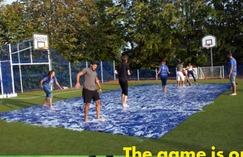
The game is on