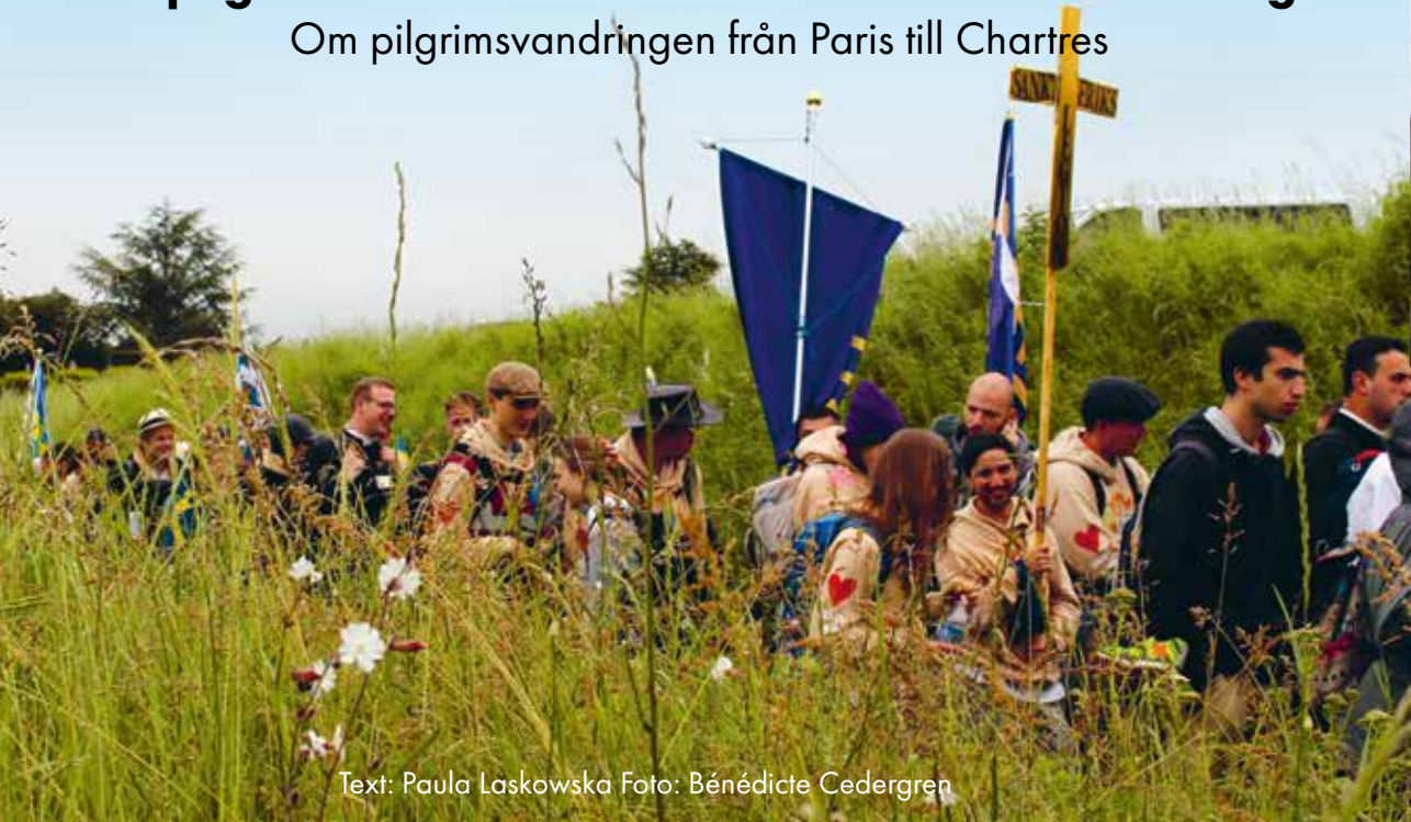
Text: Paula Laskowska

Om pilgrimsvandringen från Paris till Chartres