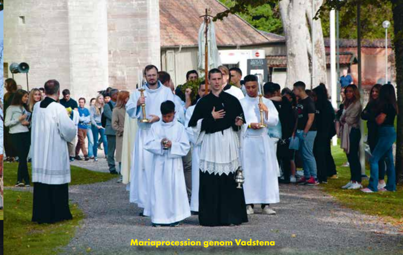
Mariaprocession genom Vadstena