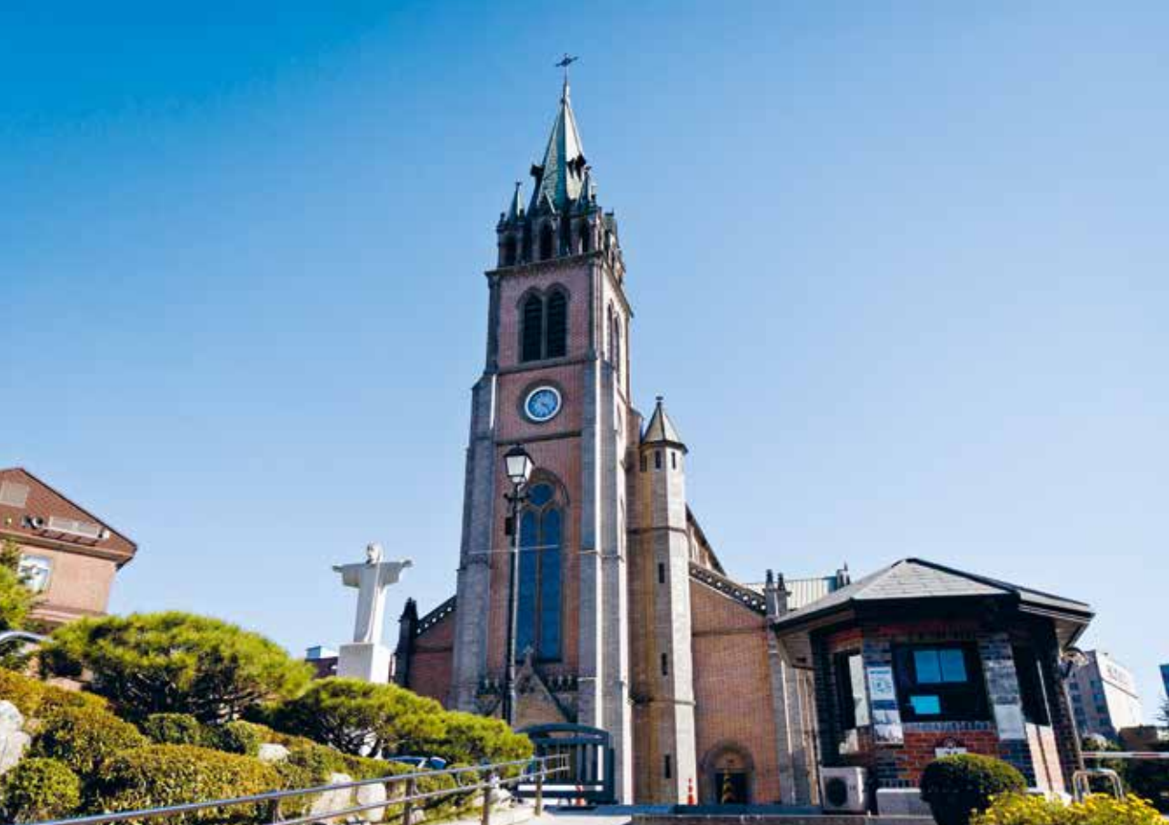
Katedralkyrkan Vår Fru av den obefläckade avlelsen som kallas Myeongdong katedralen i Seoul.

på Filippinerna 1995 som samlade nära 4 miljoner pilgrimer. VUDen med lägst antal deltagare var Sydney 2008, med runt 400 000 pilgrimer.