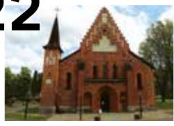
MARIAKYRKAN I SIGTUNA