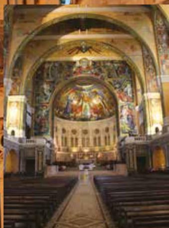
Inne i basilikan med fantastiska mosaiker!