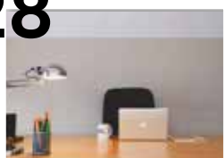
JOBBA FÖR SUK