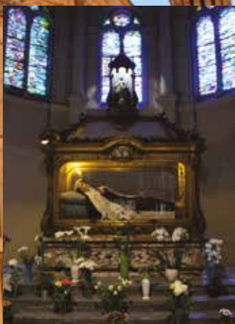
Thérèse av Lisieuxs relikier.