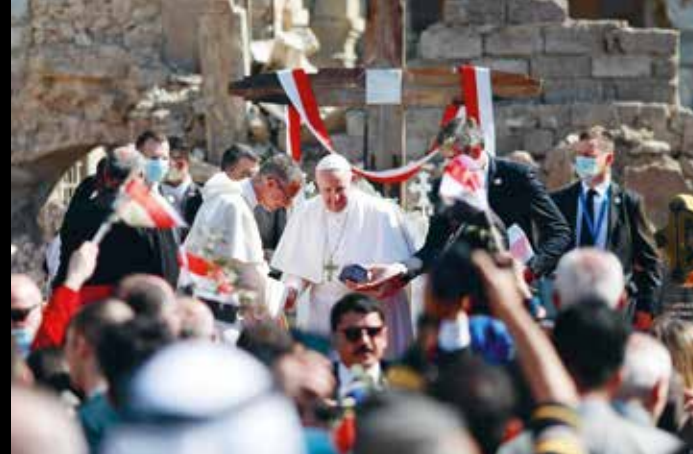
Påvens besök i Irak i mars i år har haft stor betydelse för landets kristna befolkning.

Vi har en uppgift att leva ut vår kristna tro, inte bara genom våra ord, men framför allt genom att älska varandra så som han har älskat oss. Jesus ger oss den uppmaningen innan sin himmelfärd. Han uppmanar sina lärjungar: som Fadern har sänt mig, sänder jag er att förkunna evangeliet för andra, för alla nationer och alla länder i hela världen. Den som kommer till tro, och blir döpt, blir räddad, men den som inte tror ska bli dömd. Det vi kan göra är att faktiskt följa vår Herres bud till oss. Vi blir förföljda men var inte rädda säger Jesus. Om man tittar på apostlarna, i Apostlagärningarna, när de blev skymfade, slagna, hånade, så gick de därifrån glada för att ha blivit slagna för Kristi