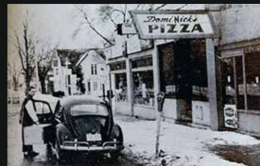
Den först Domino's Pizza butiken öppnades 1960 av bröderna James and Tom Monaghan.

– Det var åtta systrar som tog hand om femtio pojkar, vilket inte var så lätt. Systrar-