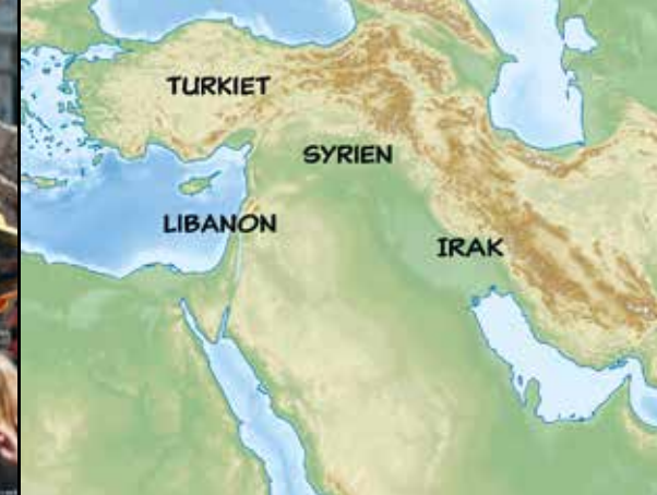
I många länder i Mellanöstern förföljs den kristna delen av befolkningen på olika sätt.

För de unga kristna i Irak, Syrien och Libanon är att vara kristen inte bara något man ägnar sig åt i kyrkan på söndagar,